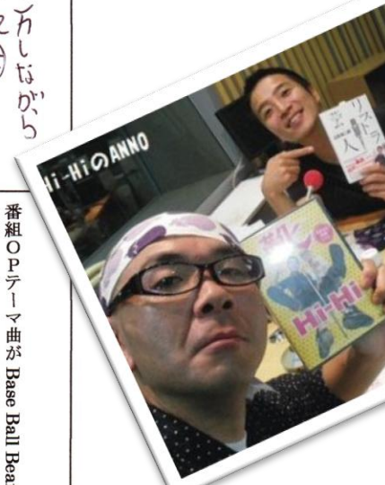
番組OPテーマ曲がBase Ball Bear「YOAKEMAE」で決定